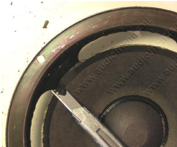
11. oben: Schaben Sie mit dem Messer die alten Sickenreste weg.