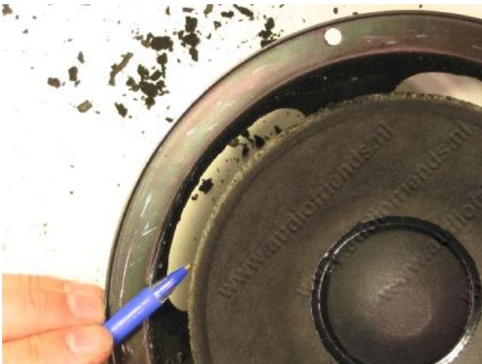
13. oben: Ein eventueller Leimrand muss entfernt werden.