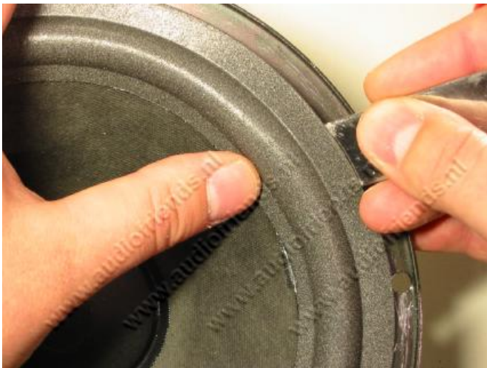
19. oben: Lassen Sie den Leim etwas antrocknen (ca. 1/3 klar und 2/3 noch weiß) bringen Sie die Sicke auf die Membran auf und drücken sie diese an. Zum Gegenhalten können Sie wieder ein Brotmesser verwenden. ( 12. )