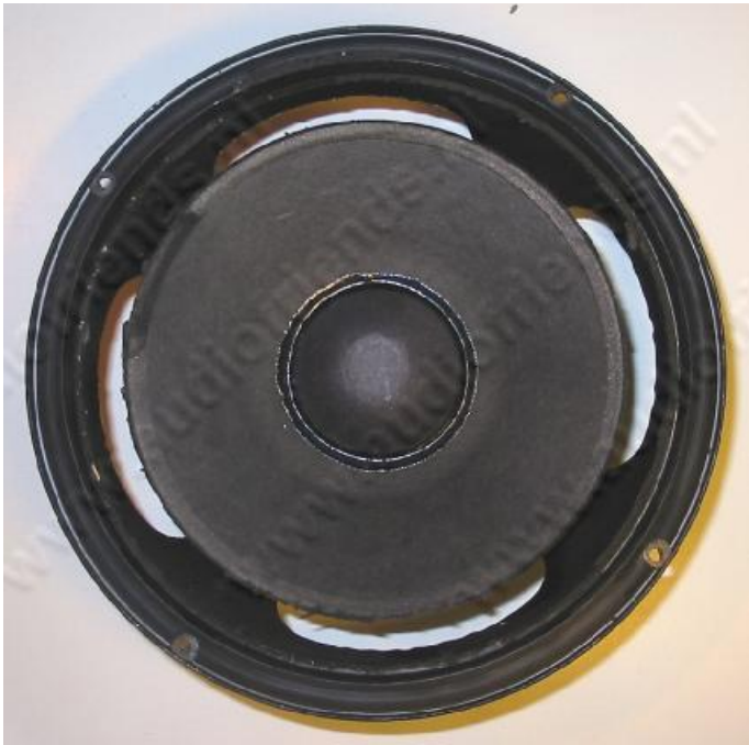
1. oben: Lautsprecher mit defekter Sicke.