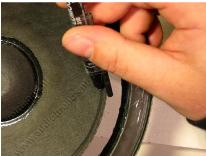
15. oben: Wenn Sie genau sind: zeichnen Sie sich einen Rand an, damit der Kleber vom Innenrand der neuen Sicke überdeckt wird.