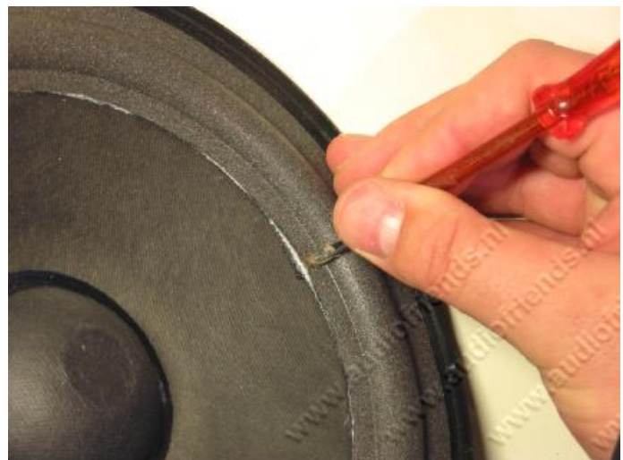
21. rechts: Eventuell übergequollener Leim mit einem Schraubendreher entfernen.

Copyright © 2004 F.E. Buist www.audiofriends.nl