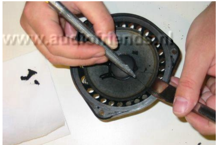
12. oben: Zum Gegenhalten können Sie z.B. ein Brotmesser verwenden.