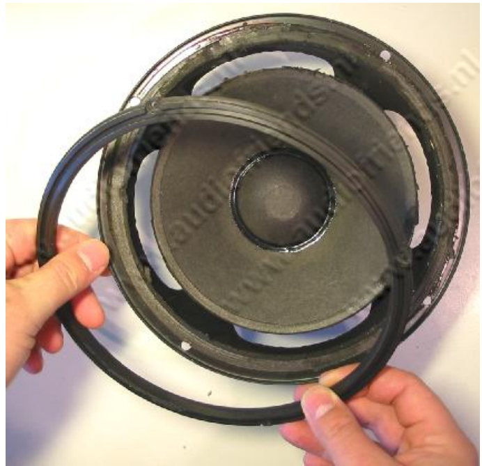
2. oben: Entfernen des Zierringes.