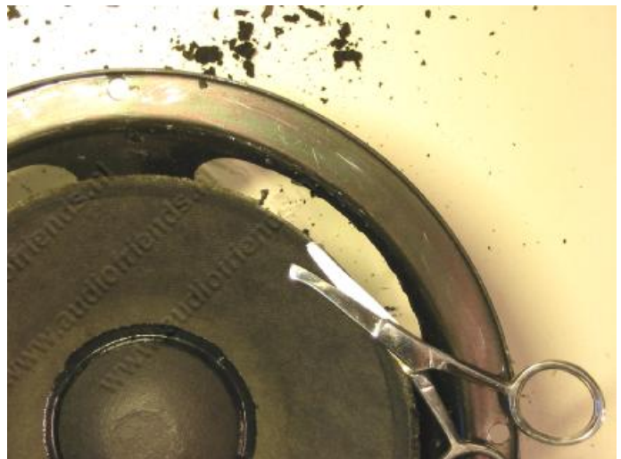
14. oben: Der Leimrand kann mit einer Schere entfernt werden.