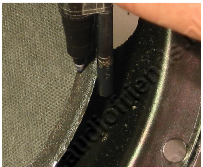
16. oben: Vergrößerter Ausschnitt.