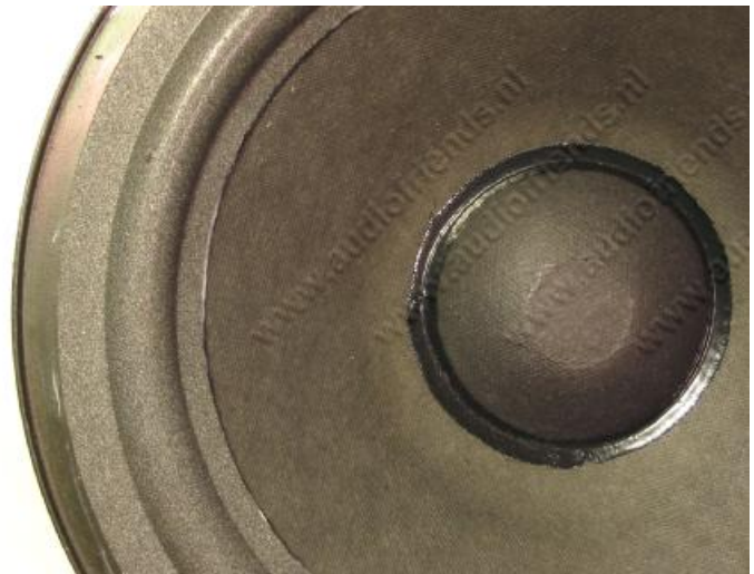
20. oben: Richtig platzierte Sicke.