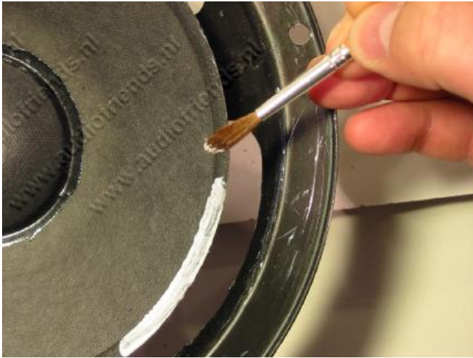
17. oben: Bestreichen Sie den Membranrand mit Kleber bis zu Ihrer Markierung. Der Kleberand sollte kleiner sein als die Breite des Innenrandes der neuen Sicke.