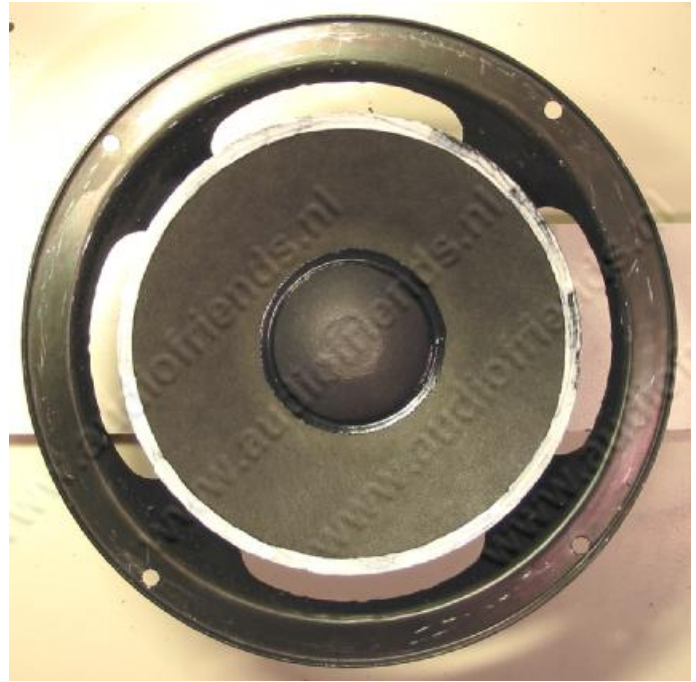
18. oben: Fertiger, mit Kleber bestrichener Membranrand.