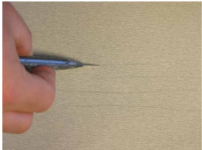
4. oben: Verrunden Sie diese Ecke mit Sandpapier.